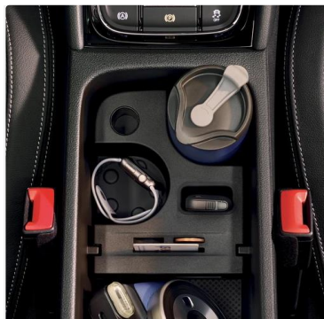
"Jumbo Box" en el reposabrazos central