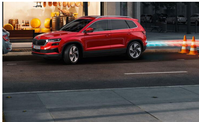
Cámara y sensores de estacionamiento delanteros y traseros