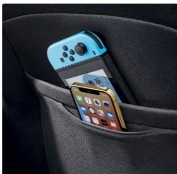
Bolsillos en el respaldo de asientos delanteros