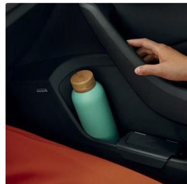
Porta botellas en todas las puertas