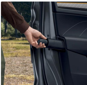
Paraguas en la puerta del conductor