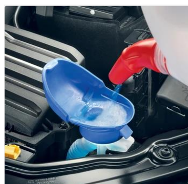
Embudo integrado para líquido limpiaparabrisas