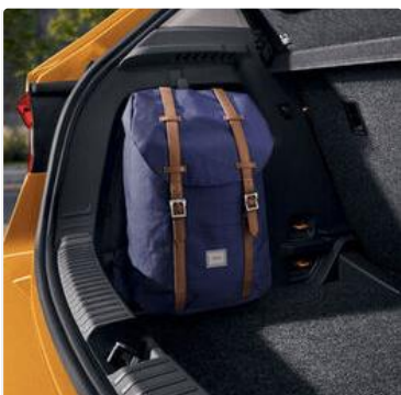
Ganchos para bolsos en el maletero